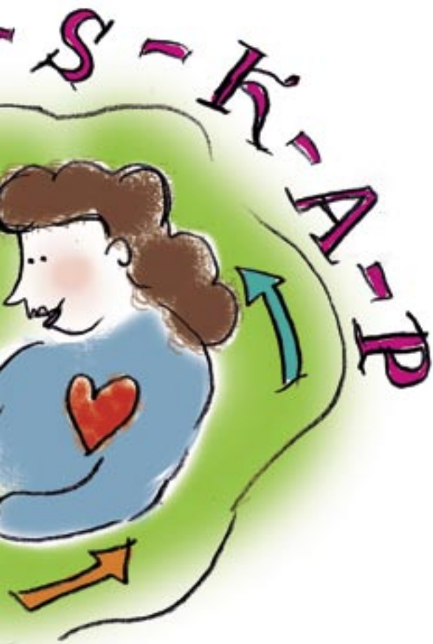
Illustration Anna Gunneström

och tro att det ska räcka till pensionen. Om vi jämför med språket, så förändras det betydligt under en period av 30 år, det gäller både tillkomsten av nya ord och betydelsen vi lägger in i befintliga ord. Det finns en slags motsvarighet för kunskap, en del av den är färskvara. Ta centrala ord inom den kyrkliga världen - som helighet och nåd - de uppfattas på ett annat sätt idag än vad de gjorde för 30 år sedan. Hur ska vi kunna förstå orden och uttrycken om vi inte får en relevant påfyllnad?