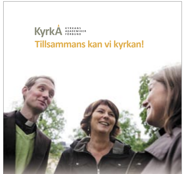
I din brevlåda nu. Delad glädje är dubbel glädje. Sprid den!

Både du som värvar en medlem och den som blir medlem i KyrkA får ett presentkort på 200 kr från Bokus!